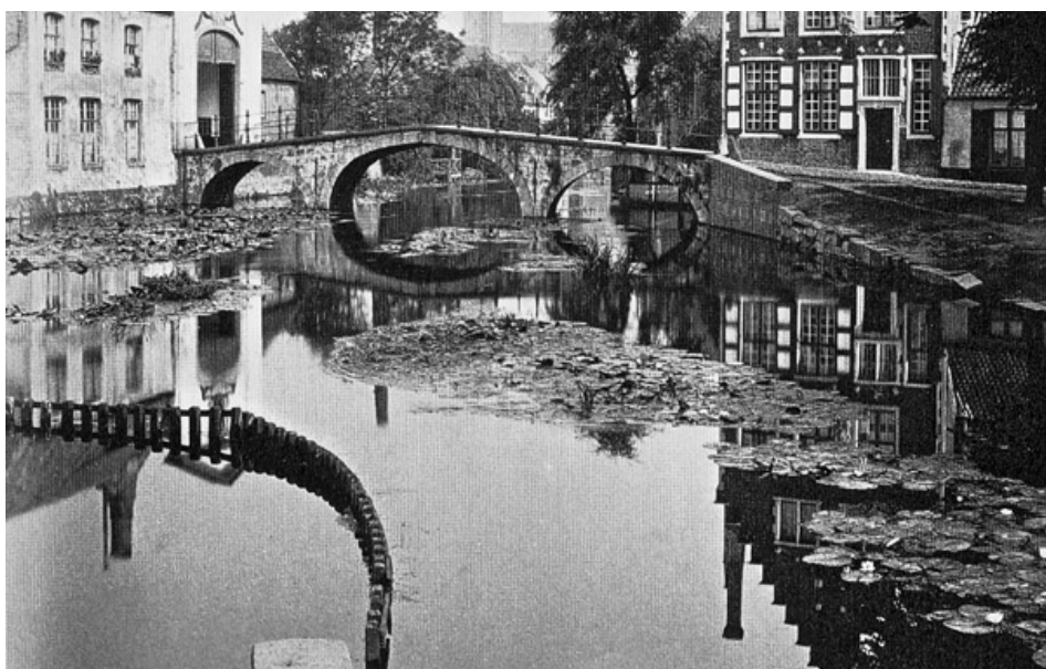
Détail de la photo de Gustave Hermans