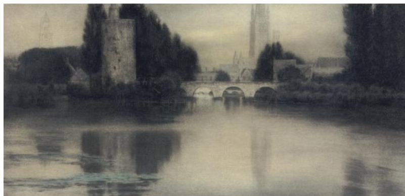
Recadrage par Khnopff les maisons à gauche ainsi que la cheminée à droite ont été effacées et la rangée d'arbres à droite est prolongée