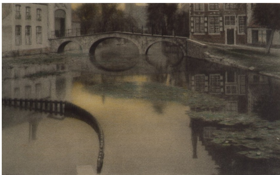
Recadré par Khnopff et le côté supérieur droit semble avoir été prolongé