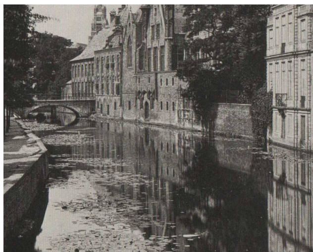
Détail de la photo de Gustave Hermans