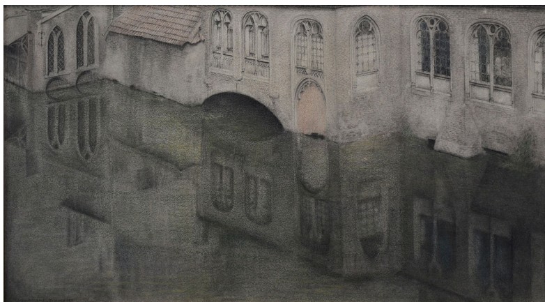
Recadré par Khnopff et le bas (l'eau du canal) semble avoir été prolongé Autrement recadrée, la photographie a été réutilisée pour le panneau central D'Autrefois (n° 413, p. 345 du Catalogue)