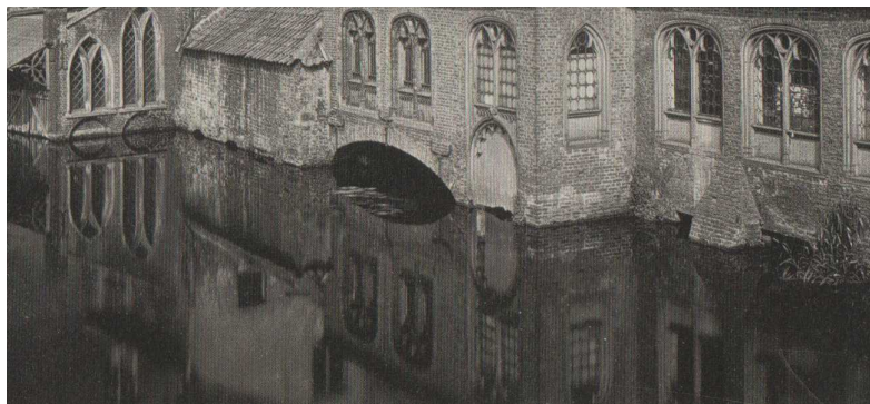
Détail de la photo de Gustave Hermans