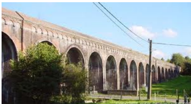
Viaduc de Braine-l'Alleud

A la fourche de deux sentiers, prendre celui de gauche. Au bout, prendre la rue à droite sur cent mètres. Attention aux voitures, serrer la gauche !